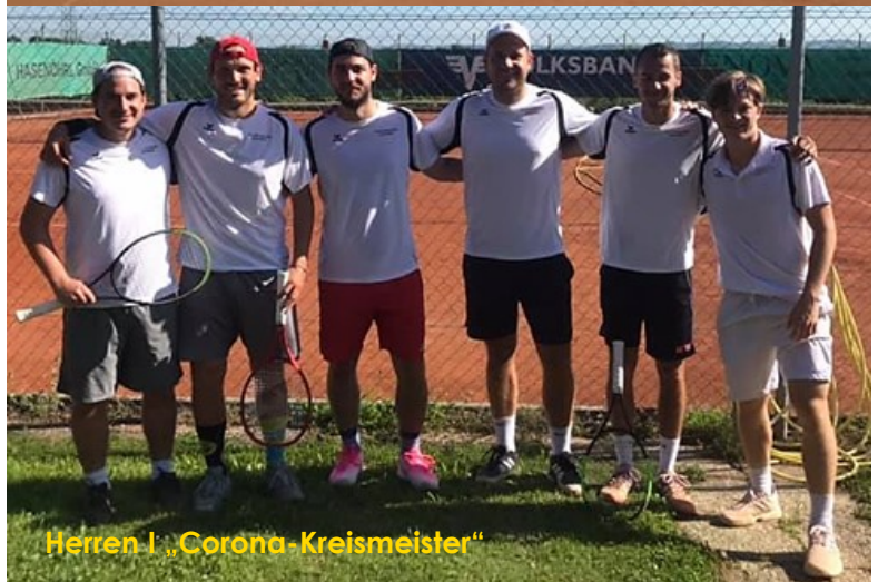
Herren I „Corona-Kreismeister“