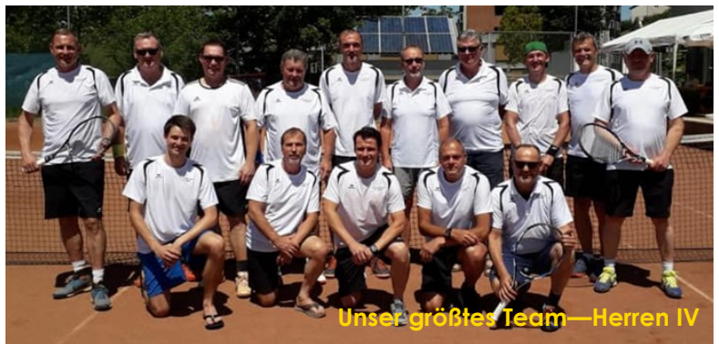
Unser größtes Team—Herren IV

Doch die Pandemie brachte auch weniger erfreuliche Nachrichten, vor allem für die Mannschaftsmeisterschaft. Nach langem Diskutieren des Verbandes entschied man sich, die Meisterschaft in freiwilliger Form ohne Auf- und Absteiger abzuhalten. Demnach trat der UTC mit drei Herrenmannschaften – erstmals spielen wir mit einer Fünfer-Mannschaft, die aus jungen Nachwuchsspielern besteht – einer Damenmannschaft, einer 60+-Seniorenmannschaft, einer 45+-Seniorinnenmannschaft und sechs Jugendmannschaften an. Unsere Zweiermannschaft (ein Mix aus Einser- und Zweiermannschaft) kürte sich zum „Corona-Kreismeister“, die Vierermannschaft belegte in der Kreisliga E den siebten Platz, unser neues Herren-Team schaffte den Sprung auf Platz vier. Die Damen platzieren sich in der Kreisliga B auf Rang drei. In der Landesliga A spielten unsere 60er-Herren. Sie werden Vierter. Den gleichen Platz erreichten die Damen-45+ in der Kreisliga. Unsere Jugend-Mannschaften spielten mit vollem Eifer, vor allem unsere U10- und U13-Einermannschaft spielte bis zum Schluss um den Kreismeistertitel mit. Beide mussten sich jedoch im Entscheidungsspiel knapp dem späteren Sieger geschlagen geben. Alle Meisterschaftsergebnisse unter www.noetv.at .