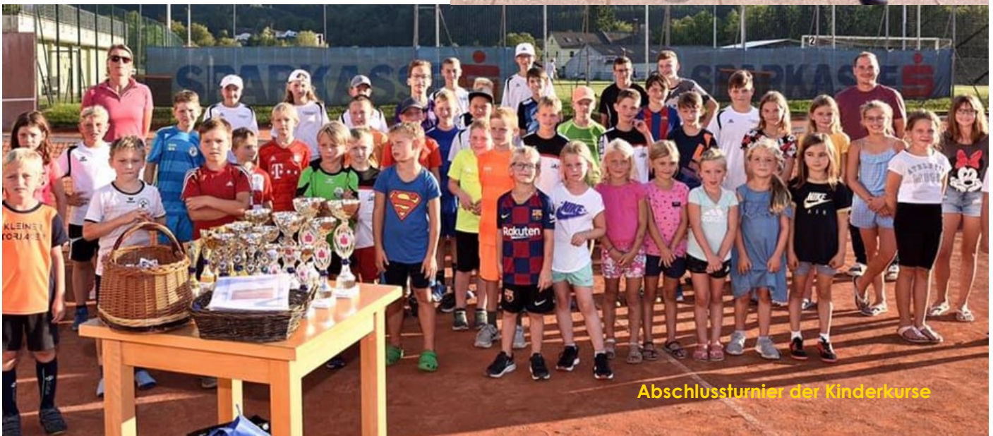
Abschlussturnier der Kinderkurse